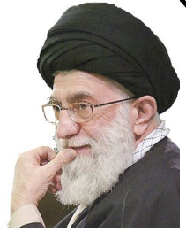
امام خامنه ای :

ما به ظهور امام زمان ، این محبوب حقیقی انسانها ، نزدیک شده ایم. ملت ایران ، به فضل پروردگار و با هدایت های معنوی ولی ... الاعظم (ارواحنا فداه) خواهد توانست کاخ پر عظمت تمدن اسلامی را بار دیگر در عالم برافراشته نماید. این آینده قطعی شماس است.